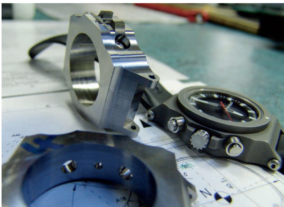
Im Vordergrund fertig gefräste Rohlinge der Uhrenschale, rechts das fertige Produkt nach der Endbearbeitung; die «griWatches extreme».

Wichtig ist hier besonders eine sehr hohe Genauigkeit; das Gehäuse und die ganze Innenkontur mit Drücker und Krone in einer einzigen Aufspannung aus dem besonderen Stangenmaterial komplett fertigen zu können, ist denn auch eine Herausforderung. Hierfür sind Stama-Maschinen besonders geeignet. «Dank nur einer