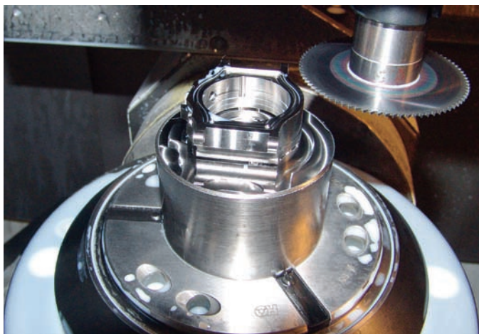
Die aus Stangenmaterial gefräste Uhrenschale in der MC 351/M.